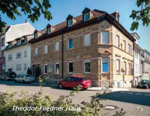
Theodor Fliedner Haus