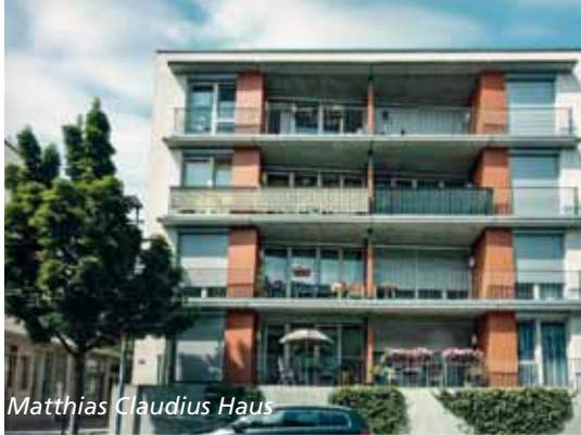
Matthias Claudius Haus