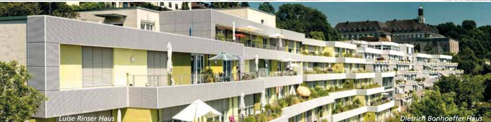
Luise Rinser Haus